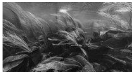
Nicolas Floc'h, Paysages productifs, Initium Maris

La Fondation de France soutient le travail du photographe Nicolas Floc'h, Initium Maris (début de la mer), autour des côtes du Finistère (fin de la terre).