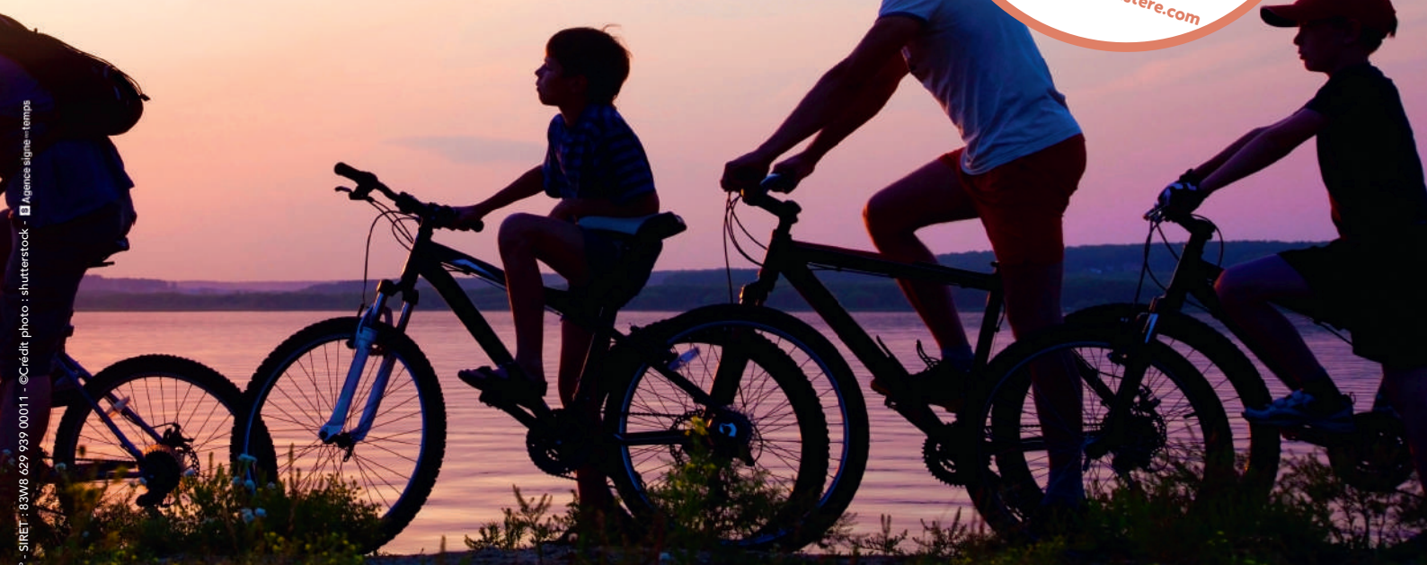
FINISTÈRE 360° - SIRET: 83308 429 939 00011

VOUS ÊTES FANS D'ÉNIGMES EN TOUT GENRE ? VOUS AIMEZ FAIRE TRAVAILLER VOS MÉNINGES ? Découvrez ce circuit vélo en famille en mode « jeu de piste » ! Renseignements auprès de l'office de tourisme ou sur toutcommenceenfinistere.com