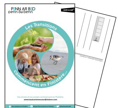
CARTE POSTALE CRÉATIVE RÉALISÉE PAR les ambassadeurs du groupe projet