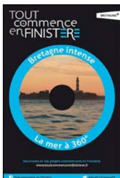
La mer à 360°