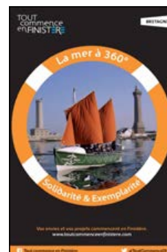
La Mer solidaire