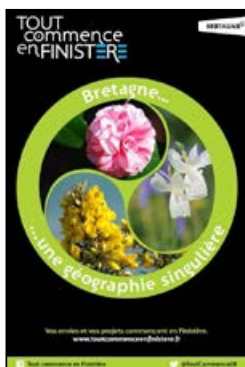
Jardin - Nature