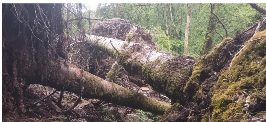
GR®37 à Huelgoat, au lieu-dit Le Gouffre.

Si certaines sections à traiter relèvent de procédures et de matériels classiques, les lieux plus escarpés et éloignés des voies d'accès habituelles ou des allées cavalières, seront traités par des entreprises spécialisées dans le travail avec traction animale, quand cela est possible. Le cheval sera en effet d'une aide indispensable pour dégager les sentiers parfois barrés sur plusieurs dizaines voire centaines de mètres par des chablis et des arbres encroués.